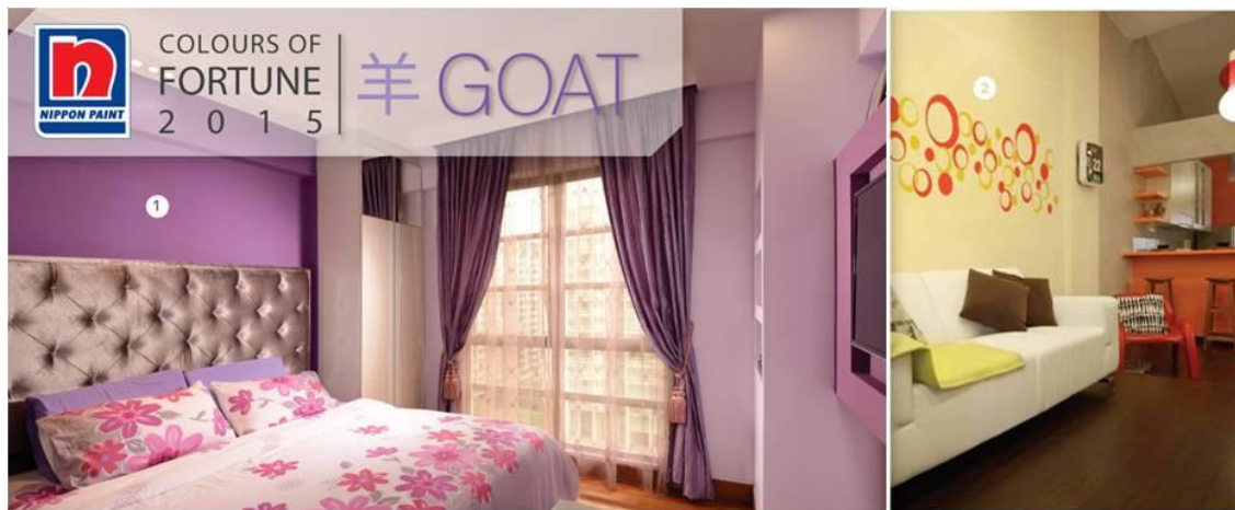
Gambar 1: Cuplikan beberapa Colours of Fortune dalam website Nippon Paint ( www.NipponPaint-Indonesia.com ) mengenai panduan warna beruntung tahun 2015 untuk salah satu dari 12 shio, yaitu shio Kambing.