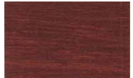
NP-012 Red Mahogany