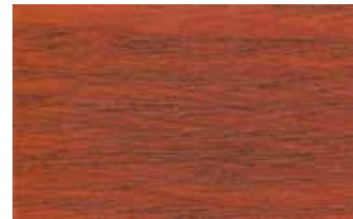
NP-003 Dark Brown