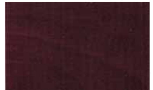
NP-015 Red Brown