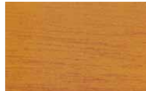
NP-004 Golden Oak