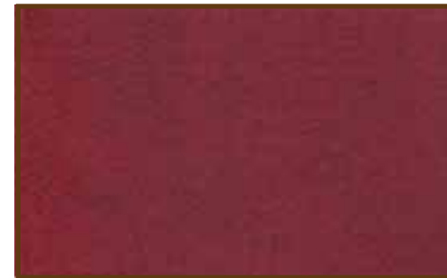
NP-002 Red Wood