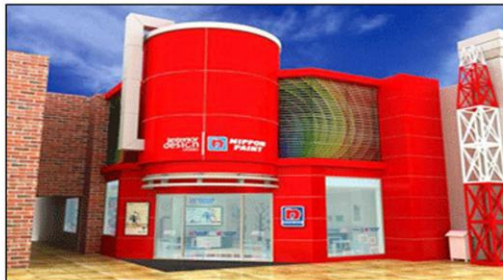
Menawarkan tiga jenis kegiatan yang menambah daya imajinasi sekaligus wawasan anak-anak.

(Berita-Bisnis) - Dikemas sebagai wahana yang seru untuk bermain sembari mengasah kreatifitas dan teamwork , PT Nippon Paint Indonesia hari ini resmi membuka establishment Nippon Paint Interior Design Studio di KidZania Jakarta.